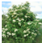
sureau en fleur

Demander aux enfants s'ils connaissent le sureau. Ils pourront se renseigner auprès de leur grand-parents car les garçons autrefois vidaient l'intérieur de la tige de sureau pour faire des sarbacanes. (je suppose qu'à la campagne cela se fait toujours.)